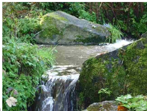
Petit ruisseau dans les Vosges (Z.A.)

Voir « s'informer (2) » ( à suivre encore )