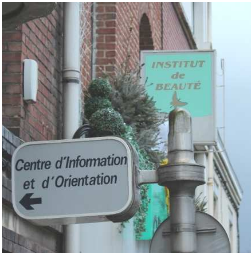
Signalétique et esthétique ou : service et commerce de proximité (Z.A.)